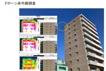
無人航空機操縦者技能証明及び赤外線建物診断技能士の有資格者によるドローン赤外線調査(協力業者) ・診断結果報告書の提出