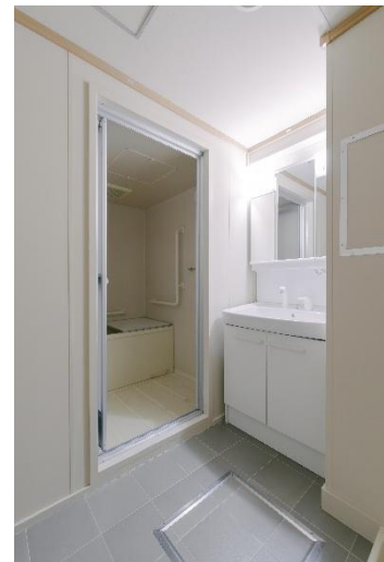
(グレードアップ風呂)

近年、多自然地域では高齢者の車離れや公共交通の縮小により、日常の買い物や医療サービスに不便を感じる入居者も増えています。県内企業と連携した共同購入や宅配などの買い物支援、宅食サービスの導入なども進めており、これらは指定管理者との連携によって実現した取組です。