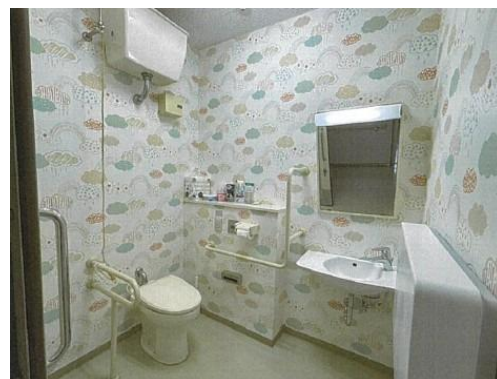
(グレードアップトイレ)

こうした取組を通じて空き住戸の解消を図るとともに、ミクストコミュニティの形成による団地全体の活性化を目指しています。現在は、さらなる施策展開に向けた検討も進めているところです。