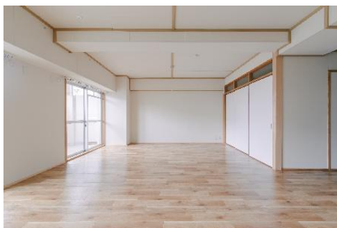
(グレードアップ LDK 化)

本稿では、県営住宅の維持管理および運営に関して、近年本県が重点的に取り組んでいる主な施策について紹介し、関係の皆様の一層のご理解とご協力をお願いしたいと考えています。