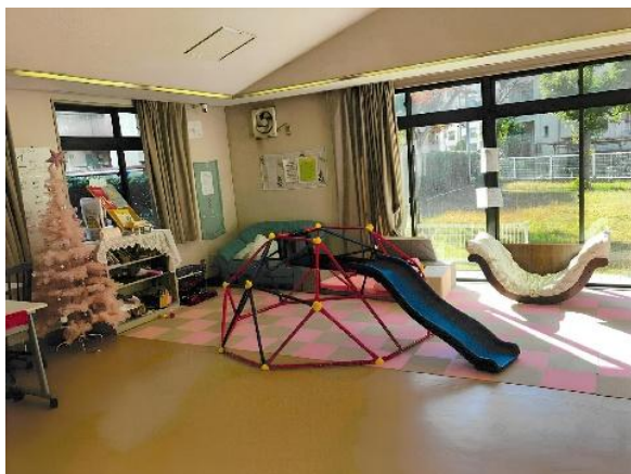
(集会所キッズルーム)

さらに、民間賃貸事業者のノウハウを活用するサブリース方式を導入し、多様化する住宅ニーズに柔軟に対応する仕組みづくりを進めています。これは、従来の公営住宅制度を補完し、重層的な住宅セーフティネットを構築する新たな取組と位置付けています。