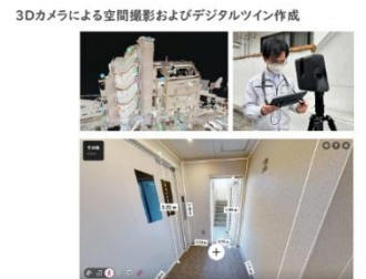
最新の3Dカメラにて建物を撮影する事で短時間での現地調査や採寸、図面作成をサポート