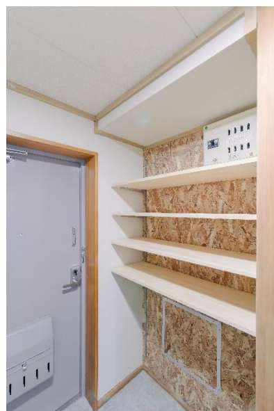
(グレードアップ玄関)

一方で、高度経済成長期や阪神・淡路大震災の復旧期に大量供給された住宅ストックの老朽化が進み、これらをいかに適切に維持管理し、更新していくかが大きな課題となっています。また、県営住宅では高齢化率が県全体の平均を大きく上回っており、生活支援の充実や空き駐車場などの遊休地の有効活用、防犯・防災や環境整備を担う自治会の活性化なども喫緊の課題となっています。