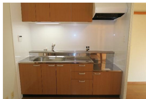
(グレードアップキッチン)