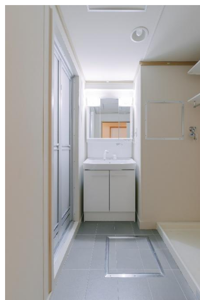
(グレードアップ洗面所)