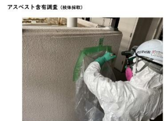
自社の建築物石棉含有建材調査者により、迅速な検体採取が可能