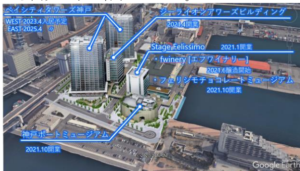
<新港第1突堤基部再開発>

神戸開港 150 年を記念し、平成 29 年から再開発に着手した新港第1突堤基部は、令和元年5月から開発工事に着手しました。