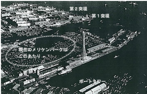
<昭和30年代の新港突堤～中突堤の様子>

都心ウォーターフロントでは、将来構想である「港都 神戸」グランドデザインや、神戸開港 150 年を機に策定した神戸港将来構想に基づいて、世界から人を惹きつける神戸のウォーターフロント形成に取り組んでいます。