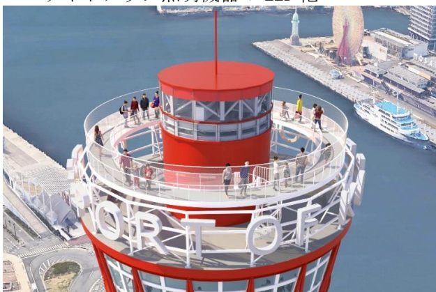
<新設される展望歩廊のイメージ>