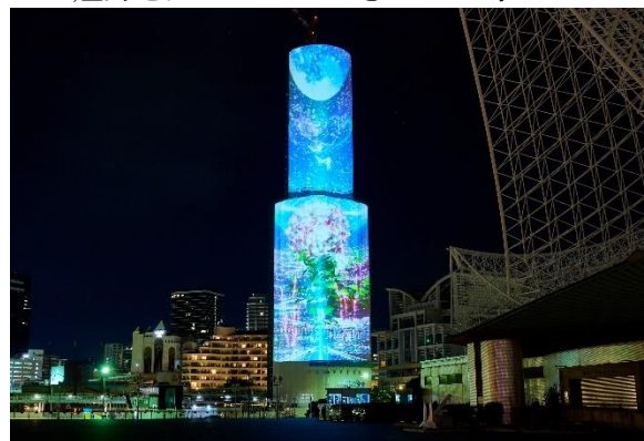
<第1弾：プロジェクションマッピング>

今後も、海外アーティストを起用したイベントや、現地を訪れた方に参加いただけるようなイベントなどの企画を予定しており、このプロジェクトを通して、多くの方にウォーターフロントエリアの魅力を知っていただきたいと考えています。