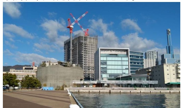
<左から、KPM、マンション棟、フェリシモ本社棟、ジーライオン本社棟>

今後は高層マンション（計700戸）のベイシテイタワーズ WEST が令和5年春頃、EAST が令和7年春頃に、入居を開始する予定です。