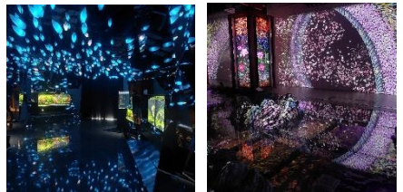
<神戸ポートミュージアムの様子>

今後は高層マンション（計700戸）のベイシテイタワーズ WEST が令和5年春頃、EAST が令和7年春頃に、入居を開始する予定です。