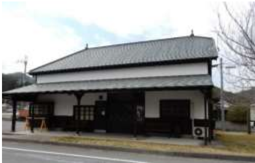
鍛冶屋線資料館として整備された 「鍛冶屋駅」(上)と「市原駅」(下)