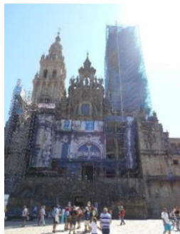
サンティアゴ・デ・コンポステーラの大聖堂

私が行ってきたサンティアゴの道とは、1993年世界遺産に登録された巡礼の道約800kmで、道として初めて登録された。熊野参詣道は同様に巡礼の道として2004年に世界遺産に登録された。