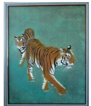
日本画 アムール虎の徘徊 (F30号)

これまで35枚余描いたが、気に入ったものは4~5枚程度に過ぎない。岩絵具を塗り重ね、下に塗った色がそこはかたなく滲んでくるような色の組み合わせがなかなか上手く描けないのが悩みでもある。2年程前に個展を開催し近しい皆様に駆けつけていただいたのも良い思い出で、できれば7~8年後にもう一度できればと思う。絵とともに額の製作も併せて行い、30数枚製作したが絵が進まないときはやキャンバス作りで気を紛らわしている。