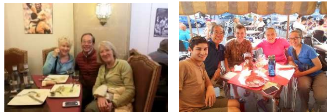
一期一会の食事会

この繰り返しで、毎日が起きて・歩いて・食べて・寝るだけの単調極まりない時間の中に身を置いてきた。単調でストレスとは無縁の日々で、スペインの田舎道を一月半も歩いていると、何とも言えない不思議な時間と異次元の空間の世界に嵌まり込んだ気分になった。