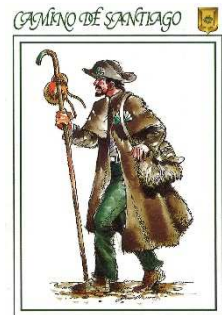
三種の神器(杖・瓢箪・帆立貝)を携えた巡礼

スペインでは、イスラム国家ウマイヤ朝による侵略後、キリスト教徒による国土を取り戻す運動(レコンキスタ)が起き、聖ヤコブの復活により、イスラム軍を打ち破り、スペインの守護聖人となった。