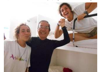
巡礼宿のコミュニケーション

私は100%、外のレストランでメニューと言う定食(巡礼定食)を摂り、内容は、6~7種類の前菜と主菜から選択し、パンが出て、水かワインにデザート